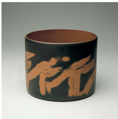
Elizabeth Nobling SP Pote ø20 h20cm

A exposição é um olhar sobre a produção artística que utiliza a terra e o fogo para formar uma linguagem: a cerâmica. Este olhar procura captar as diversas manifestações da dimensão artística, divididas aproximadamente em quatro grandes grupos: